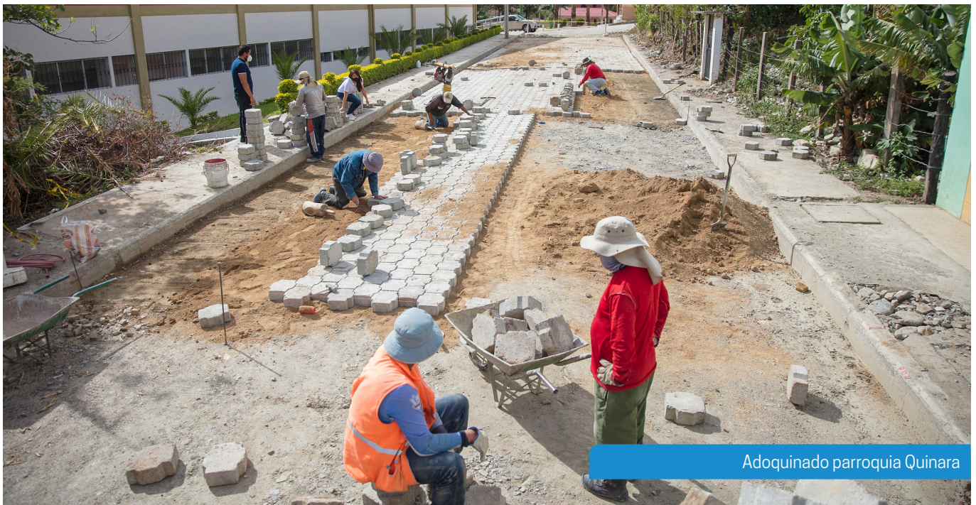
Adoquinado parroquia Quinara