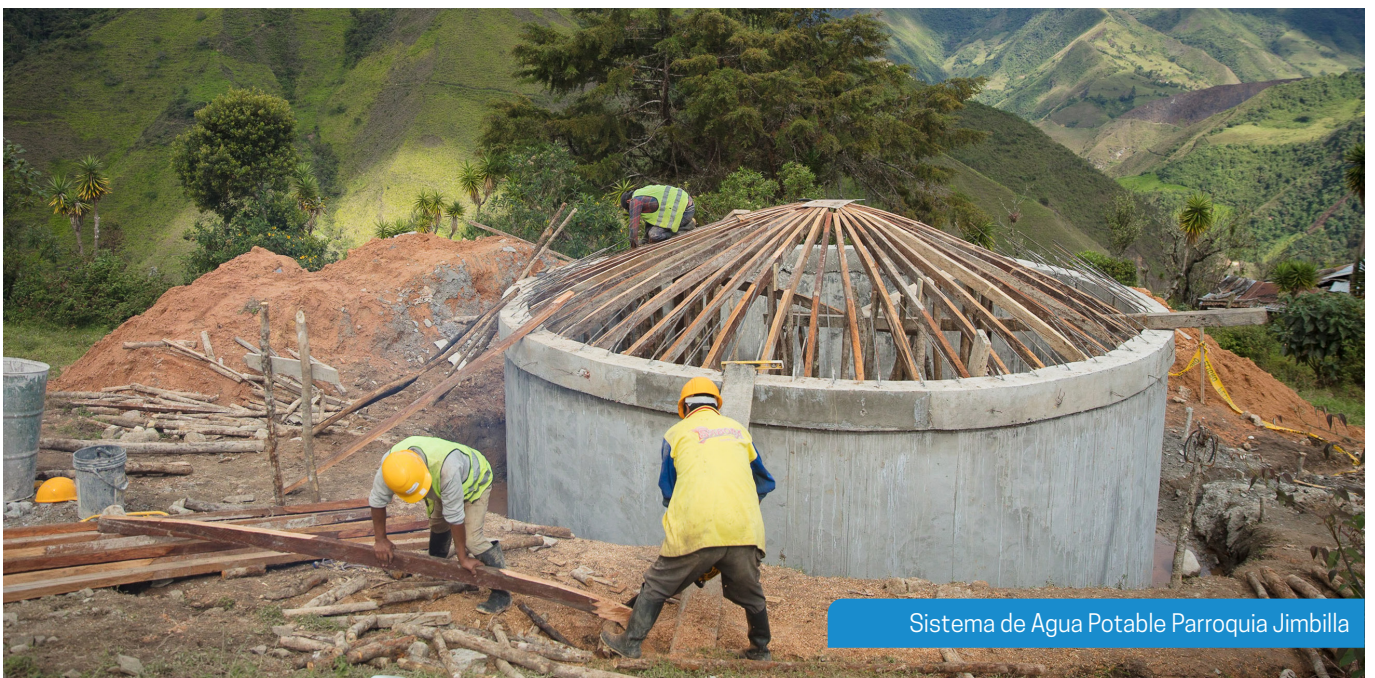
Sistema de Agua Potable Parroquia Jimbilla