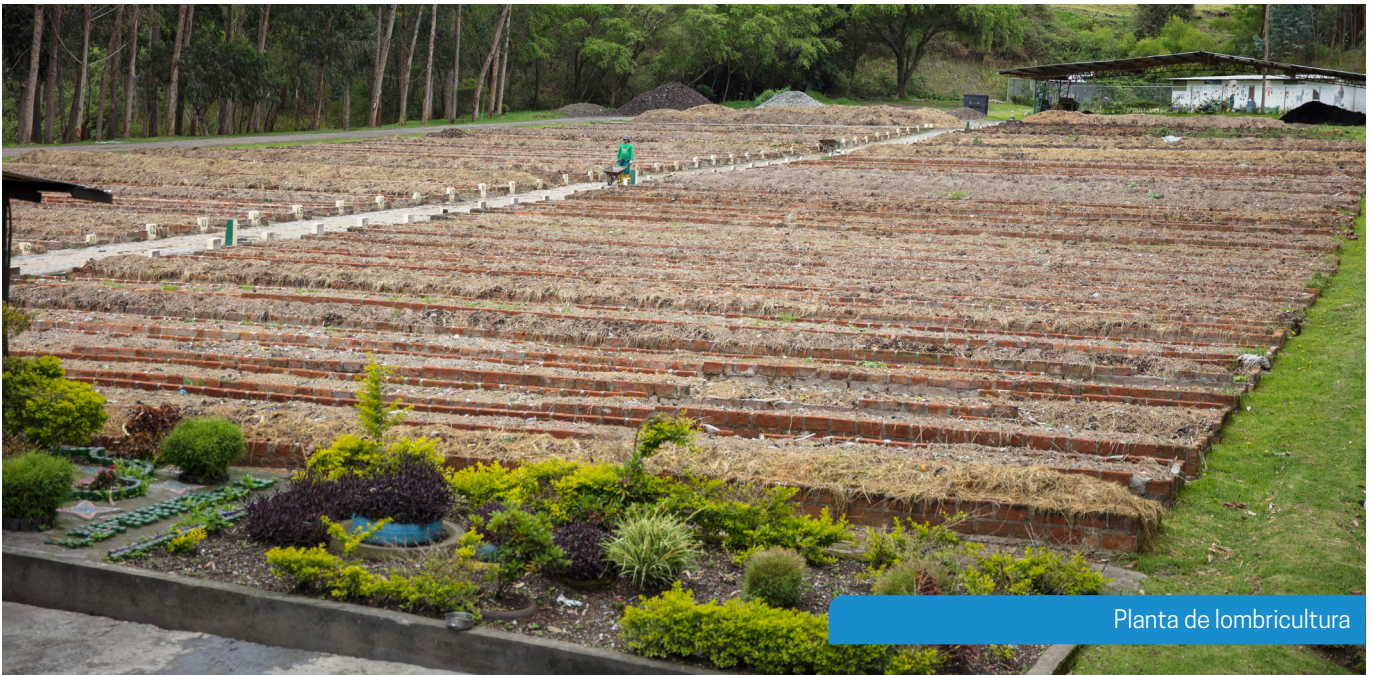
Planta de lombricultura