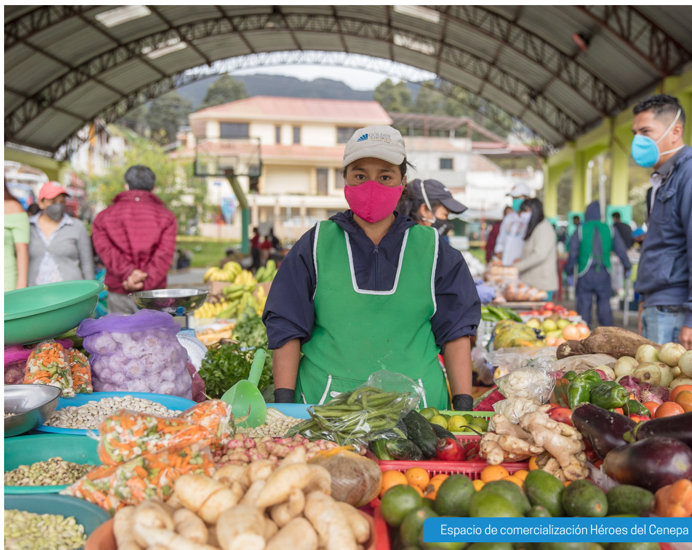
Espacio de comercialización Héroes del Cenepa