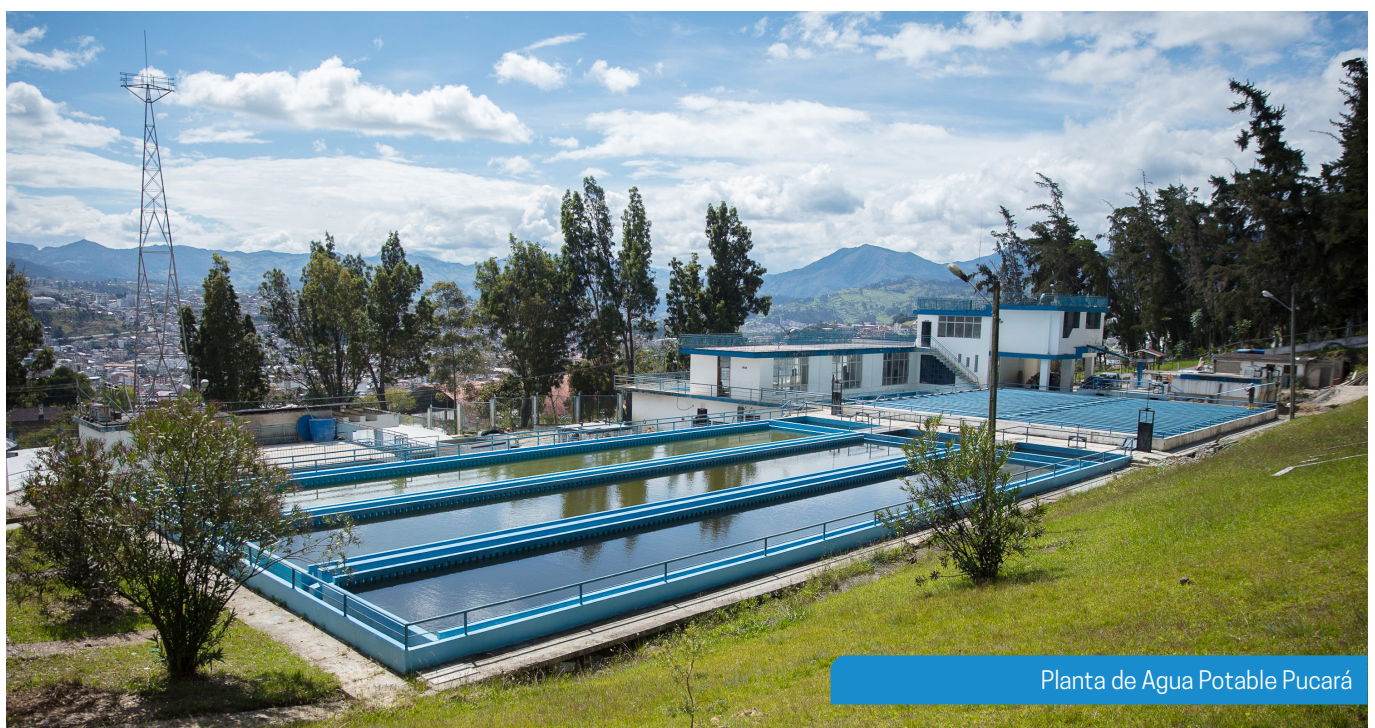
Planta de Agua Potable Pucará