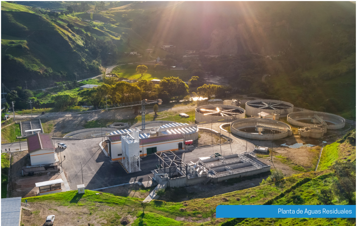
Planta de Aguas Residuales

con el proceso de recepción provisional de los diferentes componentes, donde se presentaron algunas observaciones que deberán ser corregidas por la empresa contratista para seguir con el trámite.