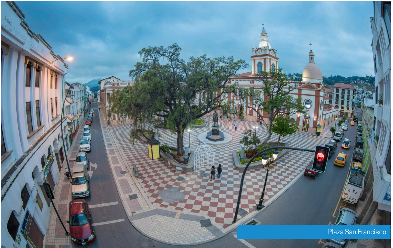
Plaza San Francisco