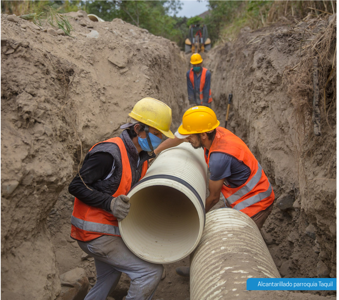
Alcantarillado parroquia Taquil