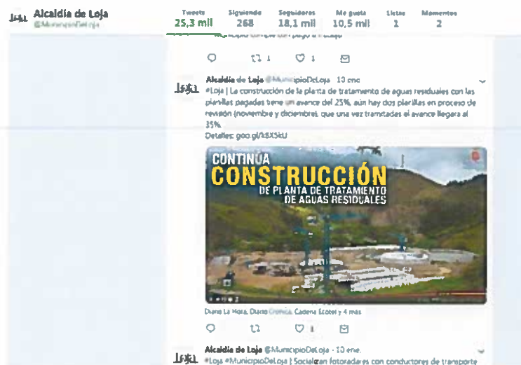
Imagen 1.- Difusión del avance de la construcción de la Planta de Tratamiento de Aguas Residuales (10-01-2019)