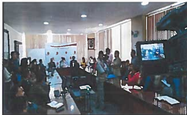
Imagen 3.- Rueda de Prensa para dar a conocer avance de la obra (09-01-2019)

De igual manera se concede entrevistas por parte del Director de la Unidad de Regeneración Urbana a los medios de comunicación institucionales y medios externos, recorridos semanales para constatar el avance de la obra, con la presencia de los técnicos de la Unidad de Regeneración Urbana, técnicos de la Empresa Constructora y de Fiscalización, Alcaldesa del Cantón y medios de comunicación.