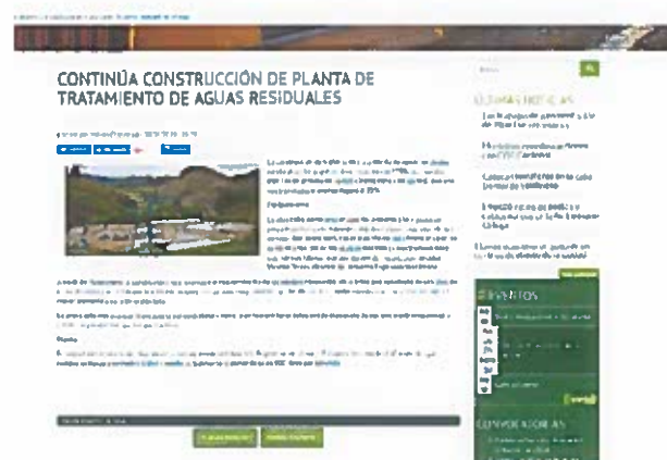
Imagen 4.- A través de boletín de prensa en página web Institucional se da a conocer porcentaje de avance de la obra (09-01-2019)