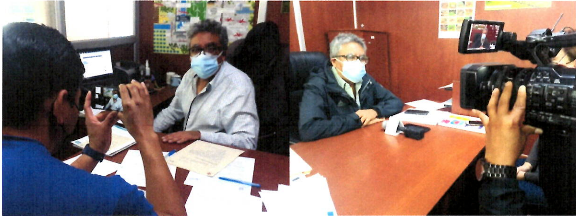
Entrevistas al director de la Unidad de Regeneración Urbana